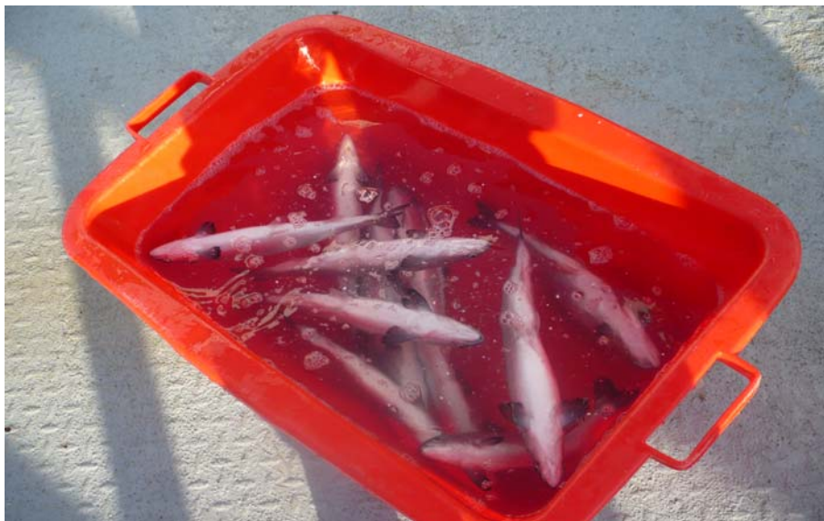
Bildet viser fisk som ble vurdert etter ovenfor nevnte kriterier.

Vestibulo Ocular Reflex (VOR) er sammen med pusting de siste refleksene som forsvinner før fisken dør og forsvinner samtidig med opphør av VER (EEG). Karakteren finnes ved å rulle fisken sakte sideveis og refleksjonen påvises dersom øynene beveger seg i forhold til hodet. Refleksjonen er treg og vanskelig å vurdere på nedkjølt fisk. Fravær av pusting og øyereflekser regnes generelt som sikre tegn på bevisstløshet på slaktedyr etter bedøving.