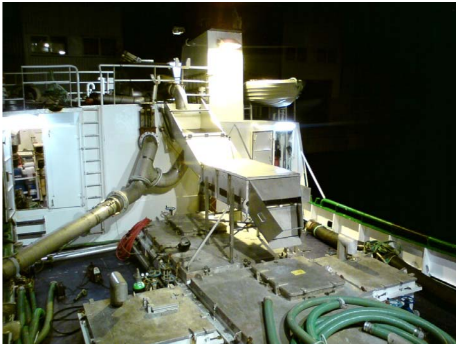
Bilde av installasjonen ombord på Haugbas. Bedøvelsessystemet er levert av Seaside as.

Haugbas er det eneste fartøyet som er godkjent som mellomliggende anlegg. Båten har en 12`` fiskepumpe som tar fisken fra oppdrettsmerd opp til øvre dekk. Der står en silekasse, som fjerner vannet. Fisken sklir ned i en åpen renne til elbedøveren. Den består av et transportbånd i metall (den ene elektroden i den elektriske kretsen) og X rader med enkeltvis hengslede ”tunger” i metall som henger ned fra oversiden (og utgjør den andre elektroden). Mengde fisk reguleres mekanisk med en klaff. Fisken bedøves ute av vann og faller etterpå ned i en tank med kvern. I elbedøveren benyttes 220 volt og 50Hz. Spenningen er betydelig høyere enn det som benyttes ved vanlig slaktebedøving av fisk. Strømparametrene er identisk med de som benyttes på landdyr (forskrift om dyrevern i slakteri) og som er kjent for å gi rask og god bedøvelse. I henhold til uttalelser fra både til leverandør og Tank og massetransport fungerer det veldig godt. Fisk helt fra 20 kilo og ned til 20-30 gram har vært kjørt gjennom systemet. Den største utfordringen er veldig liten fisk, som ikke oppnår kontakt med begge elektroder.