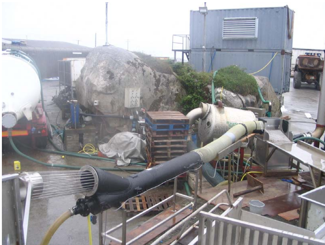
Ace Aquaculture bedøver laksen når den føres gjennom et rør.

Ett firma (Villa) har testet dette utstyret i Norge på laks og torsk. Det foreligger ingen vitenskapelige rapporter, men en del dokumentasjon er gjort internt i bedriften. Teknologien benyttes ombord på Tauranga (Marin Harvest) for å avlive fisk som ikke skal inn i produksjonen. Fisken bedøves i vann (Midling, K. et.al. 2007).