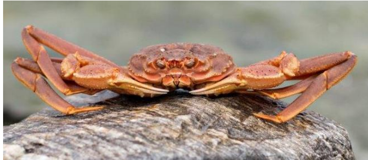
Bilde 1 Snøkrabbe ( Chionoecetes opilio ).

Snøkrabbe ( Chionoecetes opilio ) finnes på mellom 60 og 280 meters dyp på bløt- og eller sandholdig bunn innenfor et temperaturområde på -1 og 7 °C i sitt naturlige utbredelsesområde (Hardy et al., 1994; 2000) (Bilde 1). Hannen utgjør den kommersielle delen av bestanden og kan bli opptil 15 år gammel (maks skallbredde 16,5cm). På grunn av naturlig nedbryting av skallet er hannkrabben tilgjengelig for fiske i kun 3 til 4 år etter siste skallskifte (Dutil et al., 2009).